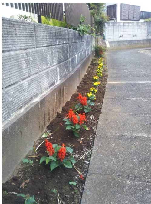
「花の小径」花壇花植後