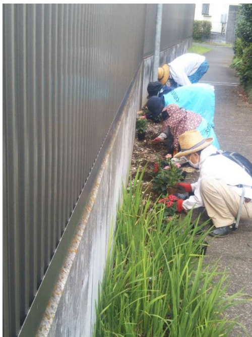
「花の小径」花壇作業中