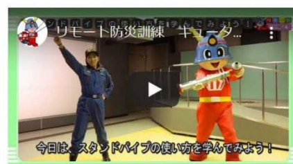
スタンドパイプの使い方