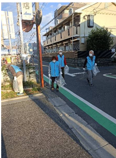
ポイ捨てタバコ他拾い