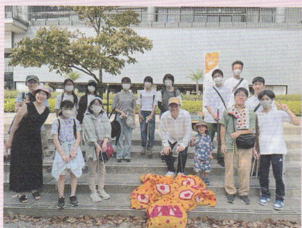
市民活動団体「グッドモーニング調布！」での清掃活動の様子